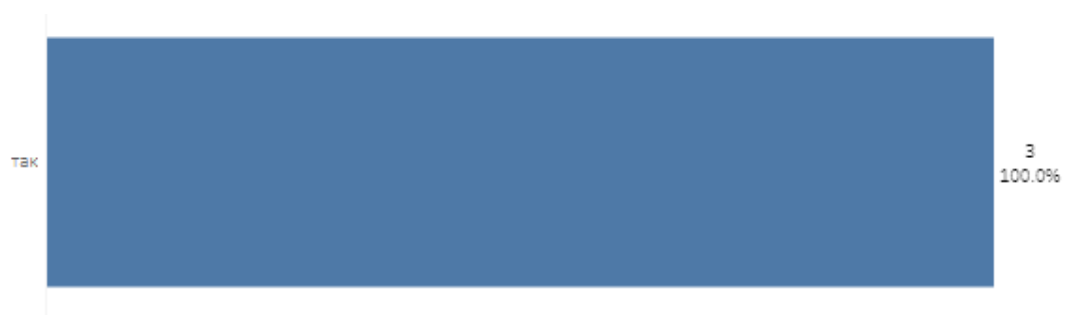
Рис.2. Чи задовольняє Вас розподіл годин на аудиторну і самостійну роботу при вивченні дисциплін?