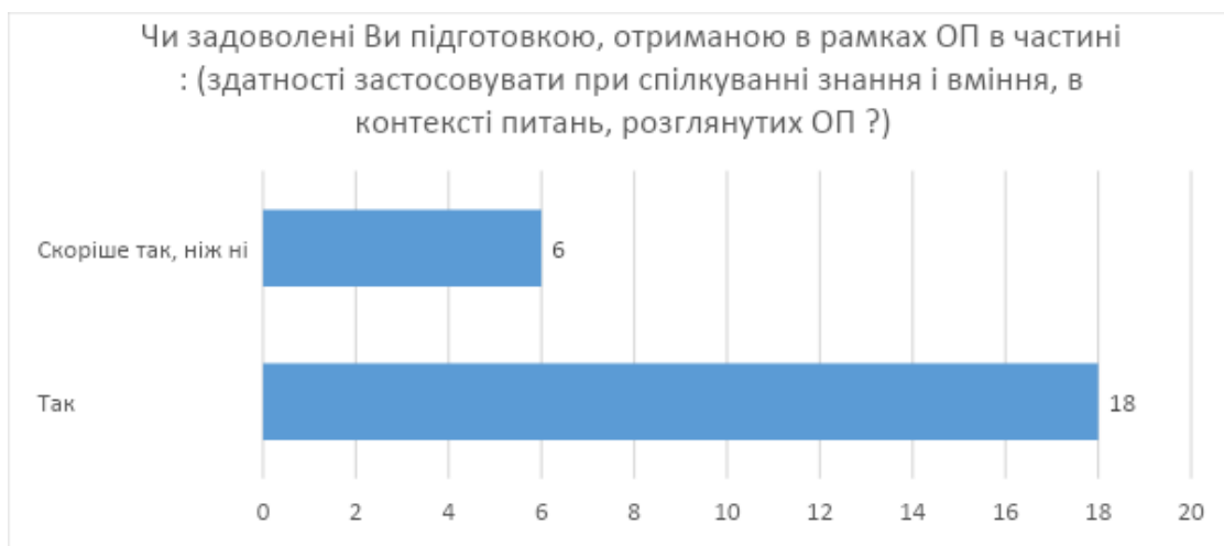
Рис. 5. Відповіді на питання щодо здатності застосовувати при спілкуванні знання і вміння, в контексті питань, розглянутих в ОП

На питання, щодо здатності застосовувати при спілкуванні знання і вміння, в контексті питань, розглянутих в ОП переважна більшість респондентів відповіли позитивно – позитивно (75%) (рис. 5).