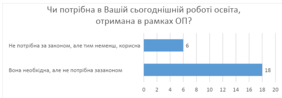
Рис. 2. Відповіді на питання щодо необхідності освіти, отриманої в рамках ОП

На питання, щодо задоволеності підготовки, отриманої в рамках ОП в частині придбаних знань з дисциплін переважна більшість респондентів відповіли позитивно – позитивно (75%) (рис. 3).