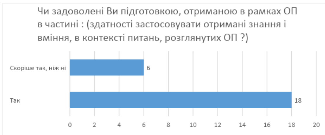
Рис. 4. Відповіді на питання щодо задоволеності підготовки, отриманої в рамках ОП в частині здатності застосовувати знання і вміння, розглянутих в ОП

На питання, щодо здатності застосовувати при спілкуванні знання і вміння, в контексті питань, розглянутих в ОП переважна більшість респондентів відповіли позитивно – позитивно (75%) (рис. 5).