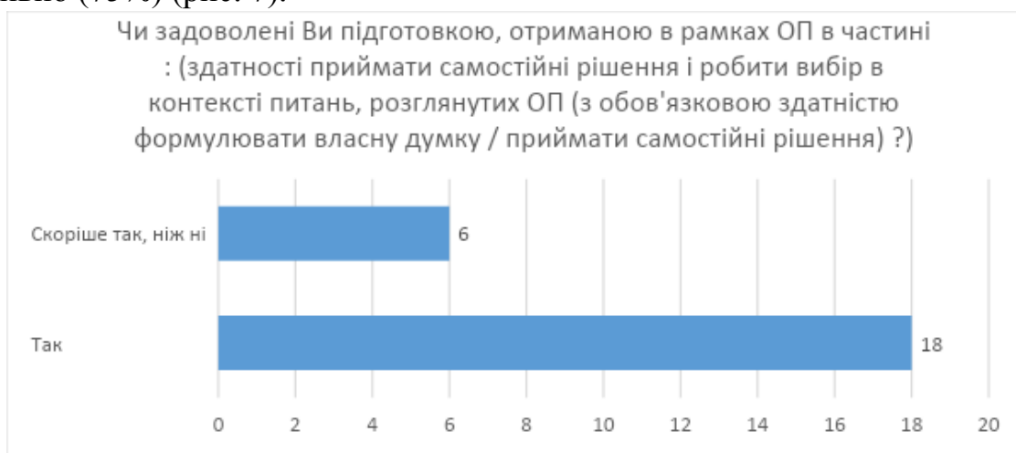
Рис. 7. Відповіді на питання щодо задоволеності підготовки, отриманої в рамках ОП в частині здатності приймати самостійні рішення і робити вибір, формулювати власну думку

На питання, щодо задоволеності підготовки, отриманої в рамках ОП в частині здатності приймати самостійні рішення і робити вибір, формулювати власну думку переважна більшість респондентів відповіли позитивно – позитивно (75%) (рис. 7).