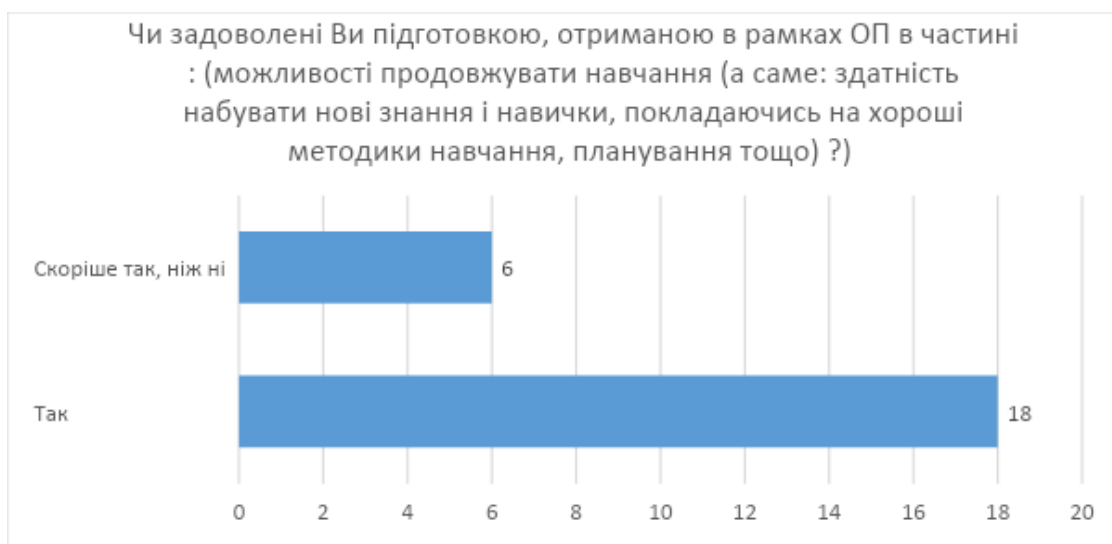
Рис. 6. Відповіді на питання щодо задоволеності підготовки, отриманої в рамках ОП в частині можливості продовжувати навчання, покладаючись на хороші методики навчання, планування, тощо

На питання, щодо задоволеності підготовки, отриманої в рамках ОП в частині здатності приймати самостійні рішення і робити вибір, формулювати власну думку переважна більшість респондентів відповіли позитивно – позитивно (75%) (рис. 7).