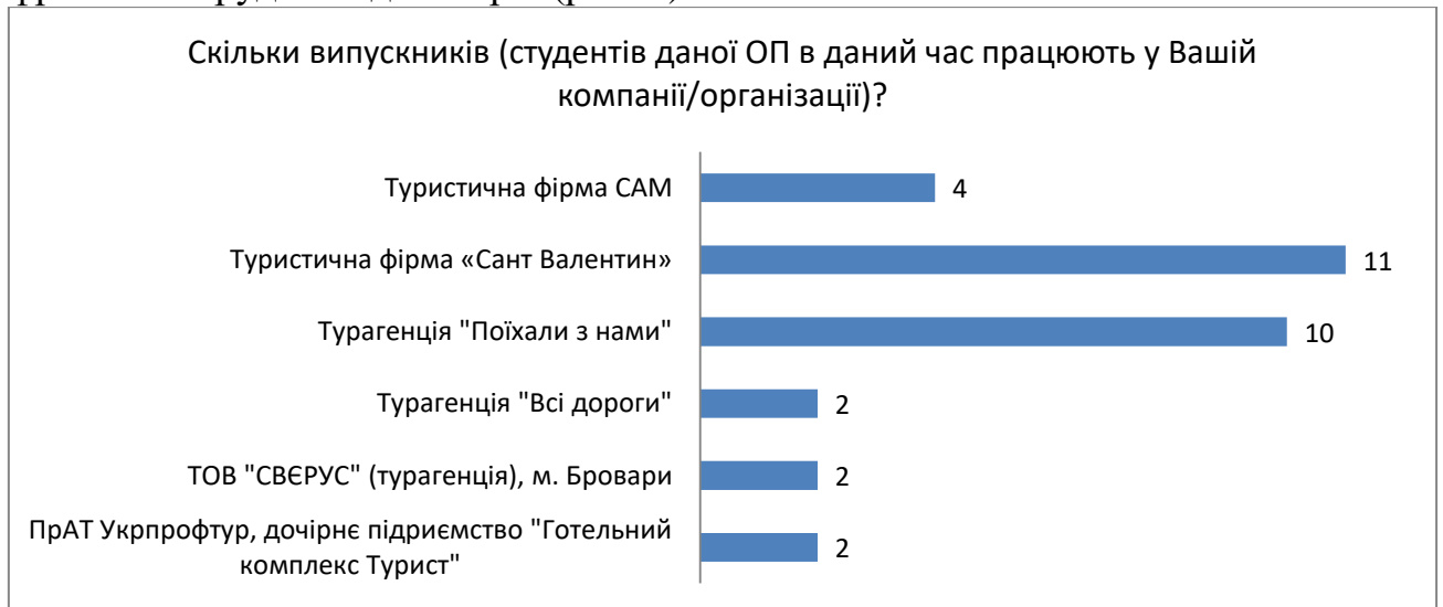
Рис. 1. Відповідь на питання, скільки випускників (студентів даної ОП в даний час працюють у Вашій компанії/організації)?

Відбір роботодавців для анкетування щодо моніторингу результатів освітньої діяльності проводився, виходячи з того, з якими фірмами чи компаніями співпрацювали випускники та здобувачі різних курсів на умовах часткової зайнятості під час навчання та здійснення певних робіт на основі фріланса / трудових договорів (рис.1.)