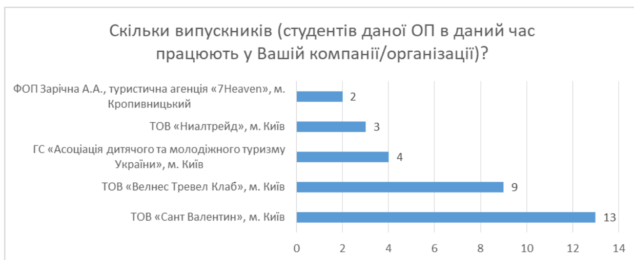
Рис. 1. Відповідь на питання, скільки випускників (студентів даної ОП в даний час працюють у Вашій компанії/організації)?

Відбір роботодавців для анкетування щодо моніторингу результатів освітньої діяльності проводився, виходячи з того, з якими фірмами чи компаніями співпрацювали випускники та здобувачі різних курсів на умовах часткової зайнятості під час навчання та здійснення певних робіт на основі фріланса / трудових договорів (рис.1.)