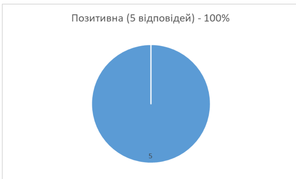
Рис. 3. Відповіді на питання щодо відповідності спеціальних, професійних компетенцій випускників ОПП «Туризм»

Чи відповідають види діяльності, які здійснюються і виконуються випускниками, працевлаштованими у Вашій компанії / організації,