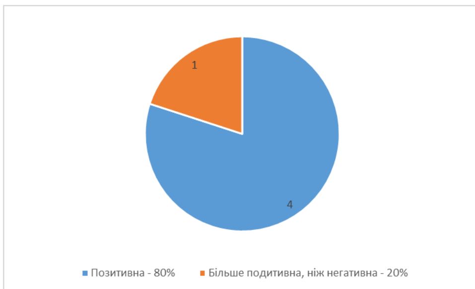
Рис. 2. Відповіді на питання щодо відповідності загальних компетенцій випускників ОПП «Туризм»

Вашій компанії / організації, переважна кількість респондентів відповіли у різному ступені позитивно – позитивно (80%) та скоріше позитивно, ніж негативно (20%) (рис. 2.). Аналогічним став розподіл відповідей роботодавців щодо спеціальних, професійних компетентностей випускників ОПП «Туризм», які працюють в даний час або працювали якийсь час назад у певній компанії / організації: 100% опитаних відповіли позитивно (рис. 3).