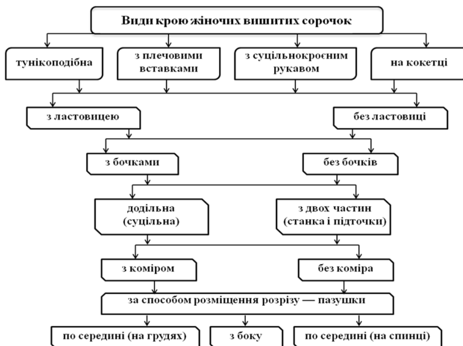
Рис. 1 Класифікація крою українських жіночих вишитих сорочок

Українські жіночі вишиті сорочки виготовлялись з домотканого лляного або конопляного полотна як додільними (суцільними), так і з двох частин: верхньої (станка) і нижньої (підточки), для виготовлення яких використовувались різні тканини: станок – з кращого тонкого лляного полотна, нижню частину – з товщої тканини. Крій сорочки визначається способом сполучення пілок полотна на плечах. Сорочки виготовлялись переважно з двох, трьох і дуже рідко чотирьох полотнищ (пілок). Сорочки могли мати ластовицю (кліни, які вшиваються в рукав для розширення пройми).